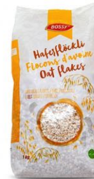
FLOCON D'AVOINE L'ADN DE L'ENTREPRISE