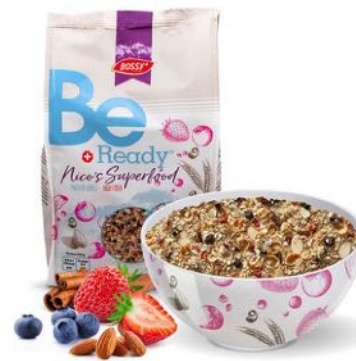
BE READY POUR LES AMATEURS DE SPORT