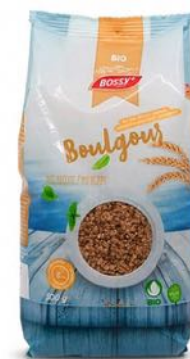
BOULGOUR LE SEUL BOULGOUR SUISSE