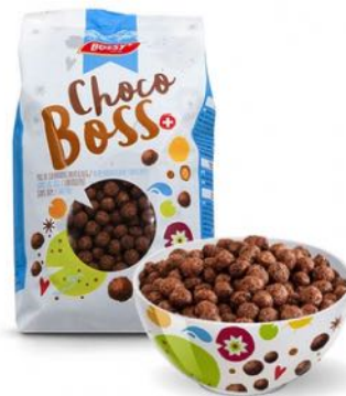
CHOCO BOSS LE PRÉFÉRÉ DES ENFANTS