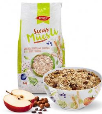
SWISS MÜESLI SELON LA RECETTE ORIGINELLE DU DOCTEUR BIRCHER-BENNER