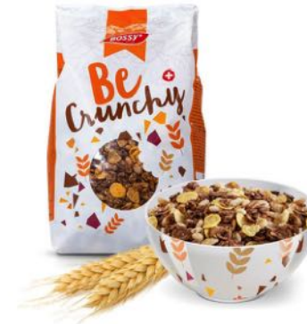
BE CRUNCHY L'ALLIÉ DES PETITS-DÉJEUNERS