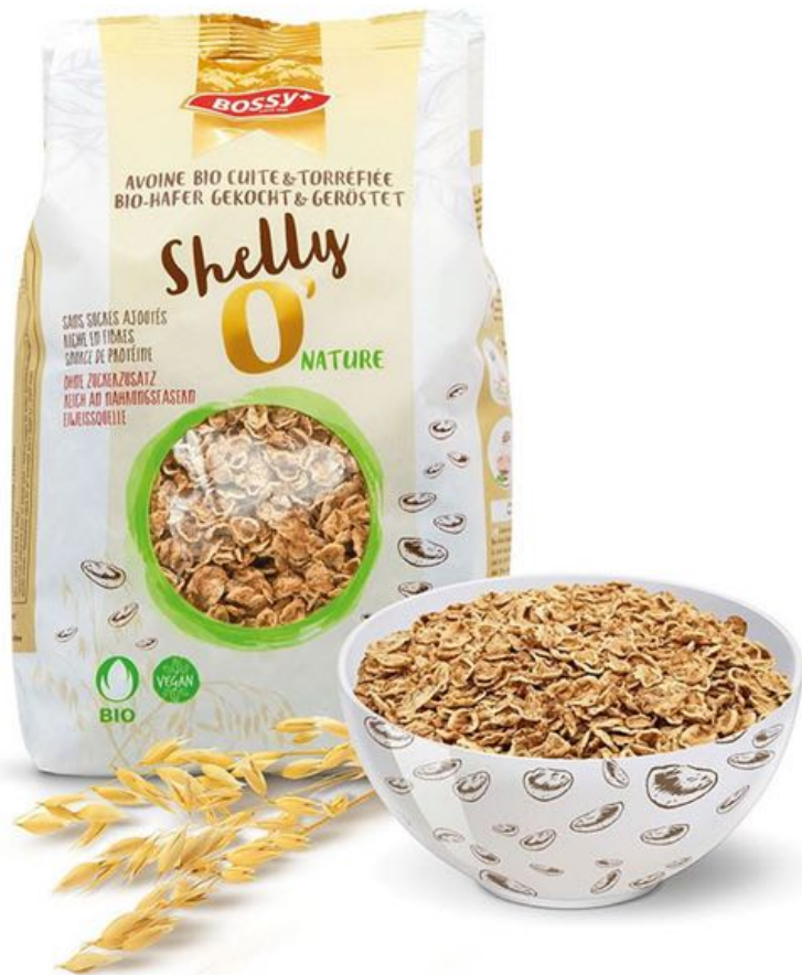
SHELLY O' UNIQUE AU MONDE